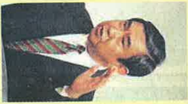
河野内閣官房長官談話(河野談話)の要旨

いわゆる従軍慰安婦問題については、半島が大... 慰安婦関係調査結果発表に関する 河野内閣官房長官談話(河野談話)