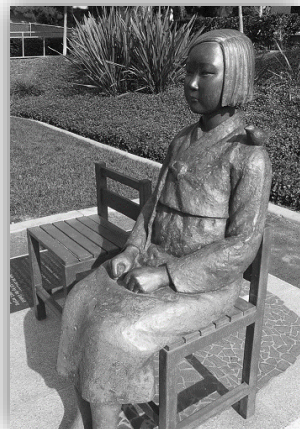
米加州グレンデール市 「日本軍性奴隷」慰安婦像